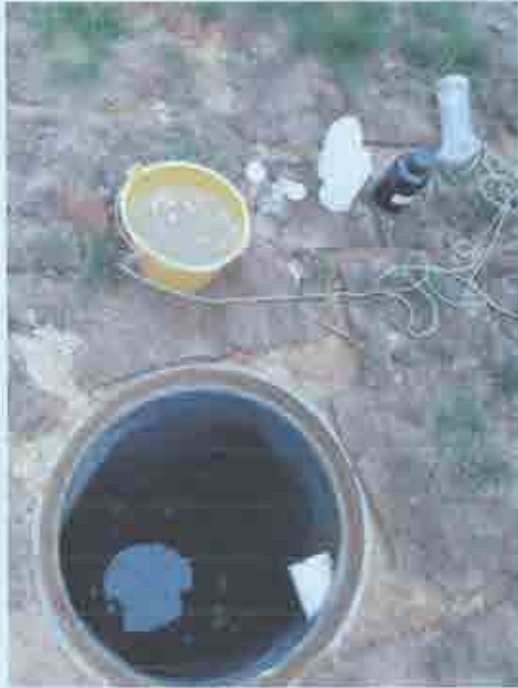
项目污水采样图片