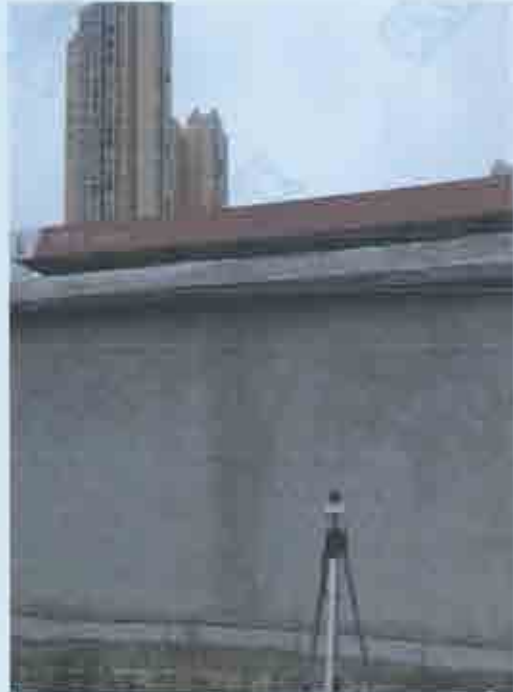
项目噪声监测图片