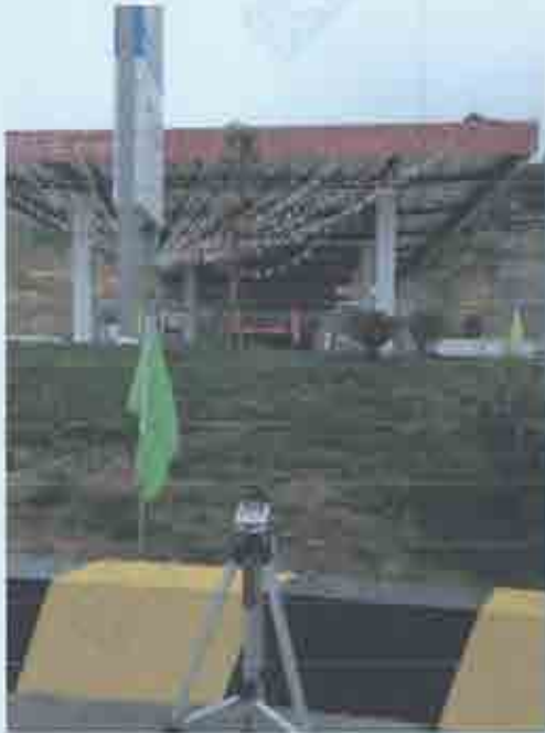
项目噪声监测图片