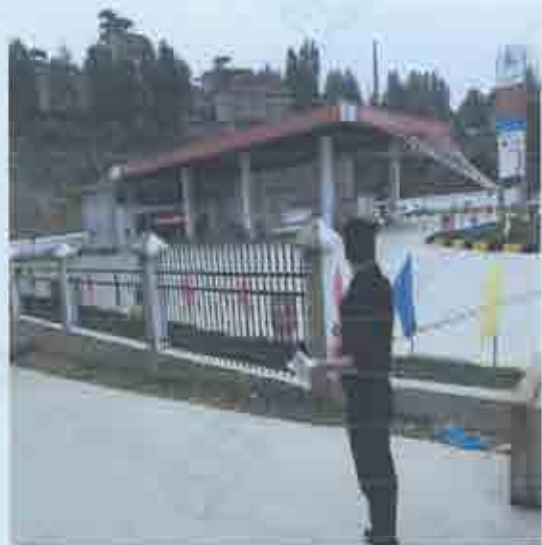
项目废气采样图片